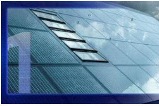
Photovoltaik: Kein Strom bei schlechtem Wetter

Energie-Experten trauen der Solarenergie viel zu. Sie schreiben der noch recht jungen Technologie ein riesiges Wachstumspotenzial zu: Schon bis 2050 – so prognostizieren ihre Anhänger – lasse sich mit Strom aus solarthermischen Kraftwerken in Marokko, Algerien und Ägypten ein Viertel des deutschen Energiebedarfs decken. Einige Vertreter der Photovoltaik sagen: Genauso viel Strom könne man in derselben Zeitspanne per Photovoltaik gewinnen, auf ungenutzten Dächern und Fassaden in Deutschland.