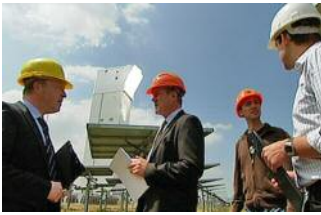
Ein Solarturmkraftwerk in Deutschland – zahlt sich die Investition aus?

Seit Anfang 2009 ist im nordrhein-westfälischen Jülich Deutschlands erstes Solarturmkraftwerk am Netz. Etwa 23,5 Euro hat es gekostet. Allein elfeinhalb Millionen Euro öffentliche Fördergelder des Bundesumweltministeriums und der Länder NRW und Bayern stecken in dem Großprojekt. Die Ausmaße sind gigantisch: Über 2.000 baumhohe Spiegel erstrecken sich auf einer Fläche von 14 Fußballfeldern, dazu ein 60-Meter-Turm. Ein gigantisches Projekt in einer Region, in der nicht gerade häufig die Sonne scheint – das klingt erst einmal alles andere als sinnvoll.