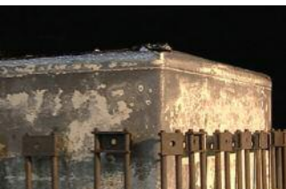
Hochreines Solarsilizium nach mehreren Tagen im Schmelzofen

Doch noch ist das Silizium nicht rein genug, um daraus Solarzellen herzustellen. Um auch die allerletzten Verunreinigungen zu entfernen, wird das Silizium noch einmal aufgeschmolzen. Nach drei Tagen bei 1400 Grad Celsius ist es dann zum „Solarsilizium“ geworden. Das liegt jetzt in großen Blöcken von fast einem mal einem Meter vor und muss vor der Weiterverarbeitung noch zersägt werden. Die dünnen Drähte, die das Silizium in dünne Scheibchen schneiden, haben damit mehr als einen halben Tag zu tun.