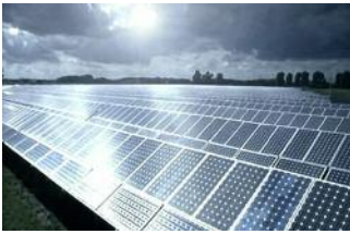
Solarpark bei Darmstadt

Lange hatte die Solarenergie den Ruf, nur als Stromlieferant für ökologische Träumer zu taugen – jetzt erlebt sie einen neuen Boom. Denn während unsere Vorräte an Kohle, Öl und Gas schwinden, wird uns bewusst, welches Potenzial in der Kraft der Sonne steckt. Schon die alten Ägypter haben ihre Bauwerke nach dem Sonnenstand ausgerichtet und so die Energie der Sonne genutzt. Auch Hohlspiegel und Brenngläser verwandten sie – der Legende nach sogar für kriegerische Zwecke. So soll beispielsweise Archimedes mit Hilfe von Spiegeln die römische Flotte in Brand gesteckt haben. Der Mechanismus, Sonnenenergie zu bündeln, um etwas zu erhitzen, ist also schon sehr lange bekannt. Trotzdem hat es dann noch über 2.000 Jahre gedauert, bis Solarforscher brauchbare Techniken zur Nutzung der Solarenergie entwickelt haben. Heute konkurrieren zwei technische Ansätze darum, die Sonnenenergie möglichst gut zu nutzen: Photovoltaik und die Solarthermie.