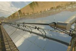
Sogenannte Parabolrinnen bündeln das Sonnenlicht

Auch Solarthermie gibt es nicht nur im kleinen Maßstab für den Privatgebrauch. Große Kraftwerke stehen im spanischen Andalusien. Die Anlage dort versorgen rund 170.000 Haushalte mit Strom. Ein Beispiel für ein solarthermisches Kraftwerk ist das Parabolrinnenkraftwerk. Bei diesem Kraftwerk fällt das Sonnenlicht auf bewegliche und gebogene Spiegelrinnen – oder Parabolrinnen. Sie bündeln das Sonnenlicht und erzeugen dadurch Hitze. Die Parabolrinne fokussiert das Sonnenlicht nicht auf einen einzelnen Brennpunkt, sondern auf eine Brennlinie in der Mitte der Rinne. In dieser Brennlinie ist ein Rohr mit einem hitzebeständigen Öl angebracht. Das Öl erhitzt sich durch die gebündelte Sonnenstrahlung auf circa 400 Grad Celsius. Im Kraftwerk heizen hunderte solcher Spiegelrinnen das Öl auf. Über ein Rohrsystem läuft das heiße Öl in einen Wärmetauscher, der Dampf erzeugt. Dieser Dampf treibt dann eine Turbine an, die Strom produziert. Den ganzen Tag folgen die Parabolrinnen dem Lauf der Sonne, so dass die Großanlage eine nahezu konstante Strommenge liefern kann.