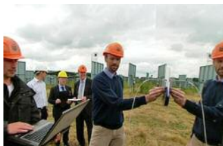
Messungen an den Kraftwerksspiegeln, den sogenannten „Heliostaten“

Das Jülicher Solarturmkraftwerk ist also ein Forschungskraftwerk – eine Art „mitwachsender“ Prototyp, in dem ständig Komponenten ausgetauscht und neue Komponenten getestet werden.