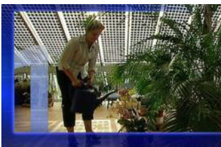
Auch Solarhausbesitzer beziehen ihren Strom aus dem öffentlichen Netz

Eins der Hauptprobleme der Photovoltaik ist die Speicherung. Denn im Gegensatz zur Wärmeenergie der Solarthermie lässt sich Strom aus Photovoltaikanlagen bisher nicht rentabel speichern. Die Verluste sind zu groß. Bei der Photovoltaik gehen also genau dann die Lichter aus, wenn man sie am dringendsten braucht – nachts oder im Winter. Die Sonneneinstrahlung in einem durchschnittlichen deutschen Sommer liegt bei bis zu 1.000 Watt pro Quadratmeter. In der dunkleren kühlen Jahreshälfte sind es weniger als die Hälfte. Um diese Schwankungen beim „Rohstoff Sonne“ auszugleichen, wird Strom vom privaten Dach meist erst ins öffentliche Netz eingespeist, bevor er wieder zum Verbraucher zurück kommt. Solarhausbesitzer stehen also abends nur deshalb nicht im Dunkeln, weil sie ihren Strom aus einem Großnetz beziehen. Und das wird zu über 85 Prozent durch konventionelle Kraftwerke gespeist.