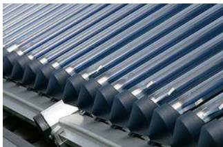
Ein Solarkollektor sammelt Sonnenenergie für warmes Wasser

Als Hausbesitzer hat man die Qual der Wahl: Möchte man die Sonne nutzen, um damit Strom zu produzieren, braucht man eine Photovoltaikanlage und möglichst viel Dachfläche für die Solarmodule. Möchte der Hausbesitzer die Sonne lieber für warmes Wasser zum Duschen und Heizen nutzen, kann eine solarthermische Anlage mit Solarkollektoren weiterhelfen. Dafür reicht auch ein kleineres Dach. Oder man entscheidet sich für beides, wie Familie Klos aus Wipperfürth. Mit insgesamt rund 120 Quadratmetern Solarmodulen auf dem Dach sind sie schon seit einem Jahr „Mini-Stromerzeuger“. Pro Kilowattstunde eingespeistem Strom bekommen sie vom Staat knapp 47 Cent – durchschnittlich 3.700 Euro im Jahr. Das macht Lust auf mehr, darum soll jetzt noch eine solarthermische Anlage aufs Dach.