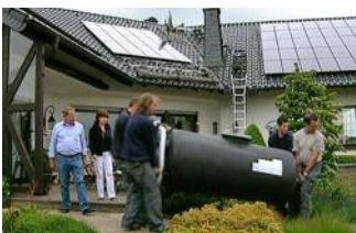
Der neue Solarspeicher muss in den Keller

Im Keller bauen die Handwerker als erstes den alten Heizkessel ab und den neuen Solarspeicher auf. Das ist ein riesiger Kessel zur Warmwasserbereitung. In diesem Fall fasst er 1.000 Liter und sorgt für einen ständigen Vorrat an warmem Wasser zum Duschen, Waschen und zur Heizungsunterstützung. Solarspeicher unterscheiden sich von klassischen Speichern aber nicht nur durch ihre Größe, sondern auch durch die Art der Wassererwärmung. Im Gegensatz zu normalen Speichern muss der Heizkessel bei Solarspeichern nur im Notfall einspringen, die meiste Zeit liefert die Sonne die nötige Heizenergie – sofern der „Solarkreislauf“ funktioniert.