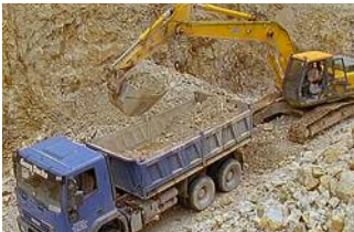
Die Herstellung von Solarzellen beginnt mit dem Abbau von Quarzsand

Der Rohstoff für die Herstellung von Solarzellen ist Silizium. Und den gibt es wie Sand am Meer. Im wahrsten Sinne des Wortes. Denn Sand ist für einen Chemiker nichts anderes als Siliziumdioxid. Und so beginnt die Herstellung einer jeden Solarzelle mit dem Einsammeln von Sand – nicht am Meer, sondern im Tagebau. Im Bayerischen Wald und in Kasachstan wird eine besonders reine Form des Sandes gewonnen. Einmal abgebaut, wird er in riesigen Öfen und chemischen Reaktoren gereinigt, bis aus ihm hochreines Silizium wird.