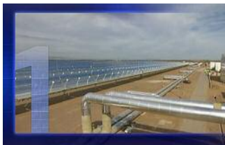
Solkraftwerke – noch arbeiten sie weniger rentabel als die konventionelle Konkurrenz

Etwa 40 Cent pro Kilowattstunde kostet Solarstrom aus der Photovoltaikanlage derzeit. Der Strom solarthermischer Kraftwerke in Spanien ist bereits heute fast nur noch halb so teuer. Der Grund: ein besserer Wirkungsgrad. Der liegt trotzdem bei gerade mal 15 bis 25 Prozent. Kern- oder Kohlekraftwerke arbeiten noch effizienter als solarthermische Kraftwerke. Sie haben Wirkungsgrade um 40 Prozent und einen noch fast unschlagbaren Strompreis: um die 5 Cent. Damit der Solarstrom trotzdem fließt, wird er subventioniert. Doch dieser Zuschuss sinkt jährlich. Allerdings arbeitet die Zeit für die Solarenergie: Der Preis für konventionellen Strom wird ansteigen, die Investitionskosten für Solaranlagen dagegen sinken. Je nach Standort soll der Preis für Solarstrom schon in den nächsten Jahren unter 10 Cent liegen.