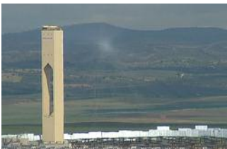
Zwei Turmkraftwerke bei Sevilla beliefern rund 15.000 Haushalte mit Solarstrom

Seit das neue Solarturmkraftwerk steht, können die Jülicher Solarforscher ihre Forschungsergebnisse gleich in der Nachbarschaft ihres Solarinstituts in die Praxis umsetzen. Bisher mussten sie dazu in die spanische Sierra Nevada reisen, zum Versuchskraftwerk des Deutschen Zentrums für Luft- und Raumfahrt. Hier haben Solarforscher allerdings bessere Arbeitsbedingungen, weil die Sonne viel öfter scheint als in Deutschland.