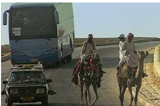
Die Afrikaner müssen zuerst profitieren

Technisch und logistisch scheint Desertec durchaus realistisch. Die Finanzierung bleibt zu klären. Aber ein weiterer, vielleicht der wichtigste Punkt, ist auch noch offen: Was sagen die Afrikaner dazu, wenn wir Europäer plötzlich an ihre Tür klopfen und in großem Stil Solarkraftwerke in ihren Sand bauen wollen?