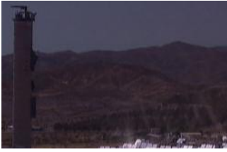
Solarturmkraftwerk des DLR im spanischen Almeria

Die Wärme kann außerdem gespeichert und erst später in Strom umgewandelt werden. Den liefert das Kraftwerk so auch bei schlechtem Wetter oder nachts. Im Vergleich zu Photovoltaik ist das der große Vorteil der Solarthermie.