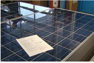
Die Herstellung von Solar- modulen ist aufwändig

Inzwischen kann man auf immer mehr deutschen Dächern Solarmodule sehen. Die blauen rechteckigen Platten schmücken nicht nur die Dächer von Besserverdienenden. Mehr oder weniger großflächig sind Solarmodule auf Dächern von Schulen, Baumärkten, Firmendächern und Sporthallen installiert. Dass sich die Installation finanziell lohnt, hat sich inzwischen herumgesprochen. Denn 20 Jahre lang wird jede einzelne Kilowattstunde Solarstrom vergütet. Das hat zeitweise eine derartige Nachfrage ausgelöst, dass der Rohstoff Silizium für die Solarzellen knapp wurde. Was sich finanziell für den Betreiber lohnen mag, muss aber nicht umweltfreundlich sein. Wie lange dauert es, bis eine Solarzelle genau den Strom erzeugt hat, der bei ihrer Herstellung benötigt wurde?